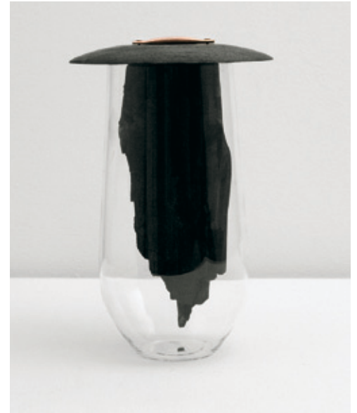
Charcoal: handgemachte Glasvase mit einem Einsatz aus Holzkohle / handmade glass vessel with charcoal insert, Formafantasma, Vitra Design Museum, 2012

2012 gegründet, unterstützt das cx die Lehre an der Akademie der Bildenden Künste München mit fachübergreifenden Projektarbeiten, Theorie-seminaren und interdisziplinären Vorträgen zu einem jährlich wechselnden Thema. „Macht des Materials / Politik der Materialität“ definierte dabei den Beschäftigungsschwerpunkt des ersten Jahres (form.de berichtete).