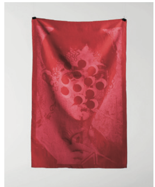
Turkish Red : Formafantasma; Textielmuseum, Tilburg, 2013

Diesem Gedanken folgend, lud das cx centrum für interdisziplinäre studien der AdBK München das Studio Formafantasma im Juni 2013 zu einem abendlichen Gespräch ein.