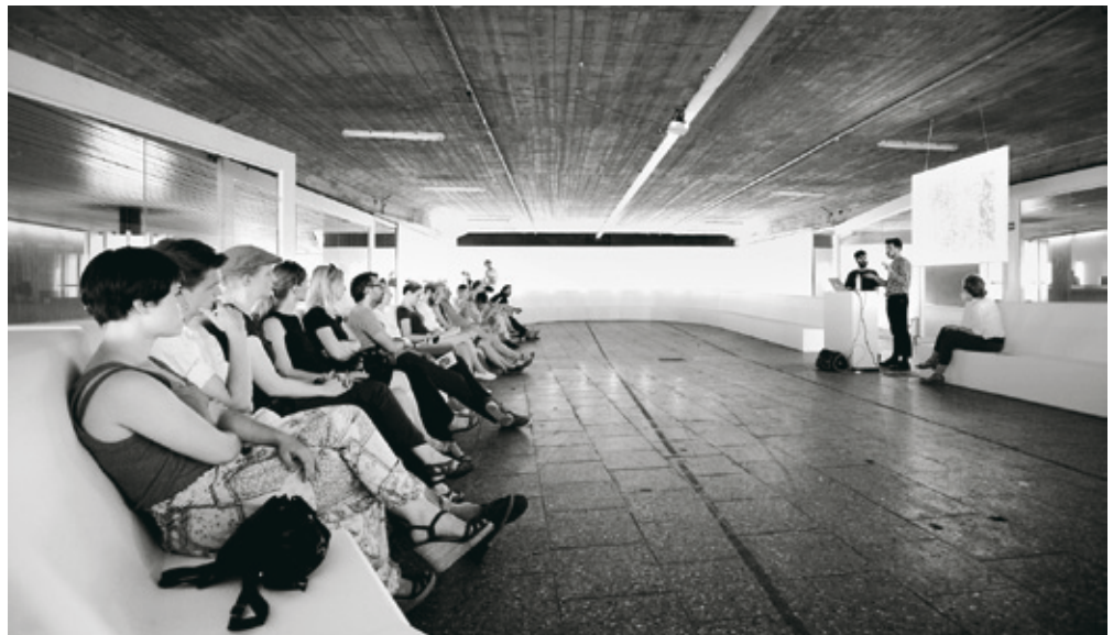
„Neue Alchimisten“ / “New Alchemists” Formafantasma, MaximiliansForum, June 2013

formafantasma.com adbk.de maximiliansforum.de