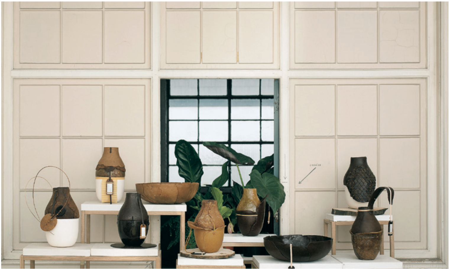
Botanica series: Formafantasma, Plart Foundation, 2011

theoretical seminars and interdisciplinary talks on a different topic each year. “The power of material / the politics of materiality” was the central theme of its inaugural year.