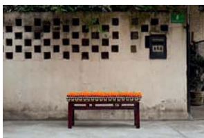
Bench , de Gu Yeli, 2012.