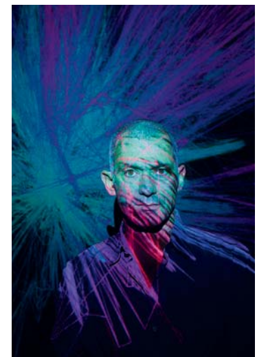
Osmosis Interactive Arena d'Arik Levy pour Swarovski

Célébrant le 20 e anniversaire du studio de graphisme M/M (Paris) et la sortie d'une monographie